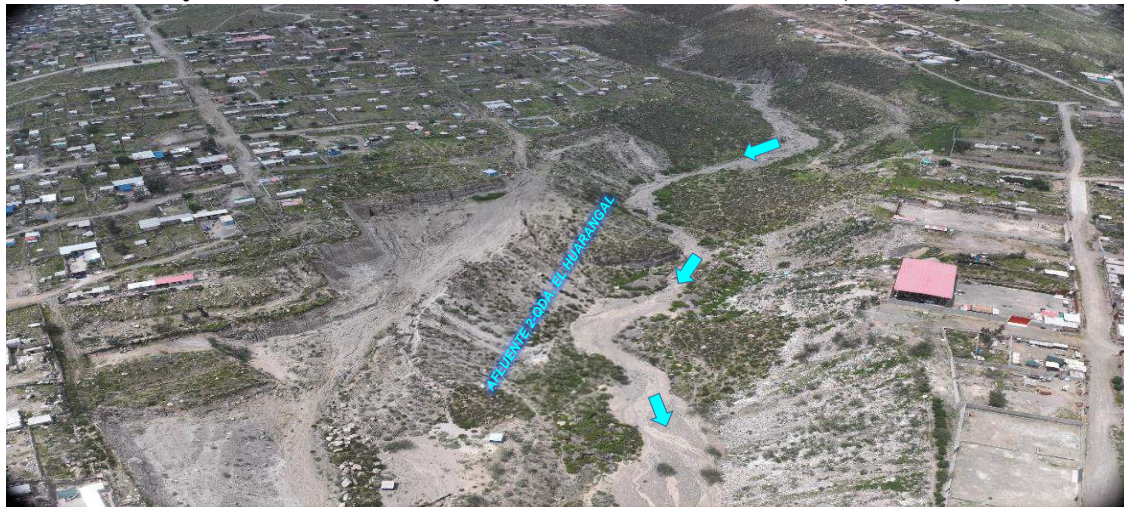
Imagen N° 2. Zona colmatada en el tramo, en donde se observa sedimentación en el cauce del Afluyente 2-quebrada El Huarangal.