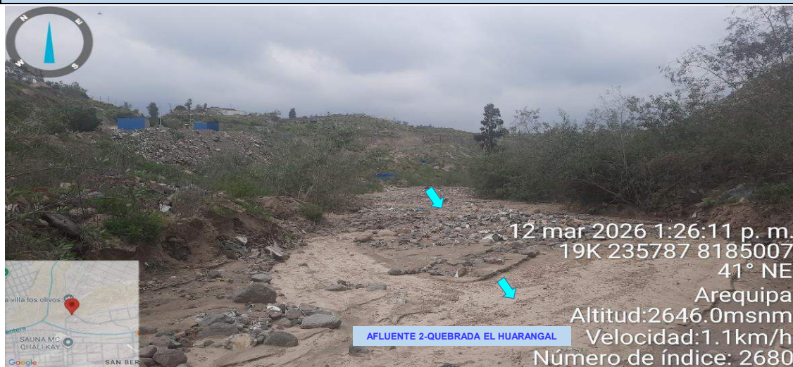
Imagen N° 1. Tramo colmatado en el sector Chiguata 1, en donde se observa sedimentación en el cauce del Afluyente 2-quebrada El Huarangal.