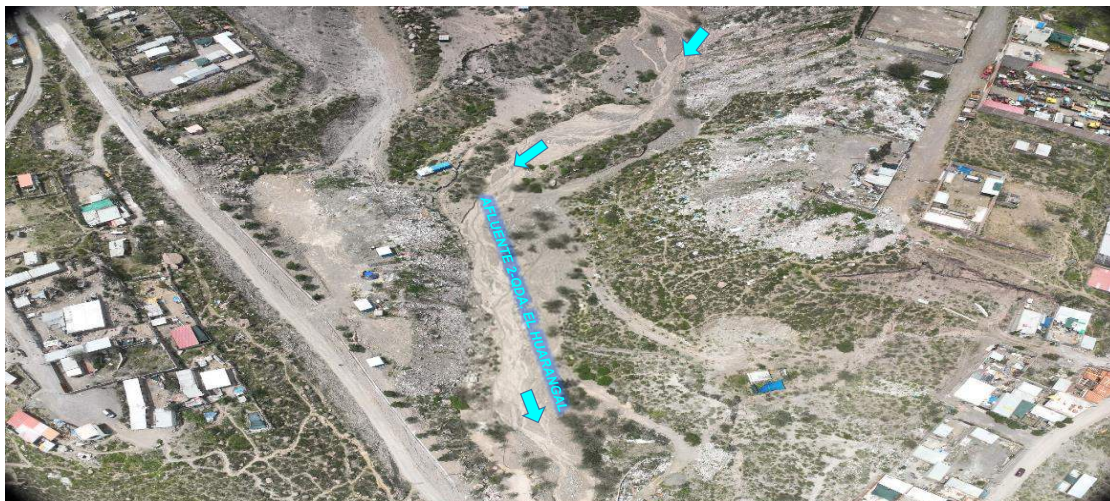
Imagen N° 3. Zona colmatada en el tramo, en donde se observa sedimentación en el cauce del Afluente 2-quebrada El Huarangal.